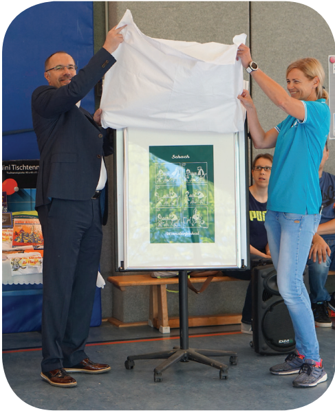
Bürgermeister Steffen Zenner