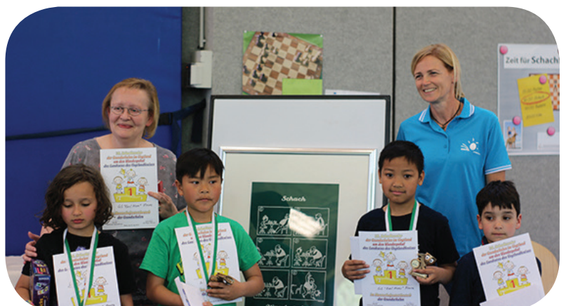
Die Siegermannschaft 2018 der GS „Karl Marx“ Plauen